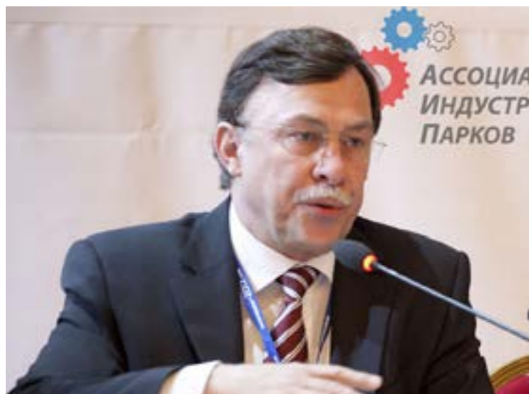
Дитрих МЁЛЛЕР, Президент Siemens в России и Центральной Азии, 2012 г.