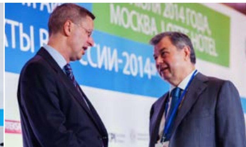
Михаэль ХАРМС, Глава Российско-Германской внешнеторговой палаты Анатолий АРТАМОНОВ, Губернатор Калужской области, 2014 г.