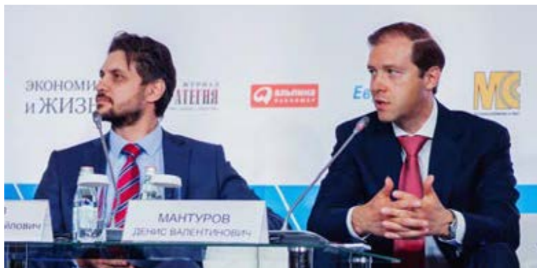
Денис МАНТУРОВ, Министр промышленности и торговли РФ, Александр ОСИПОВ, Первый заместитель Министра РФ по развитию Дальнего Востока, 2014 г.